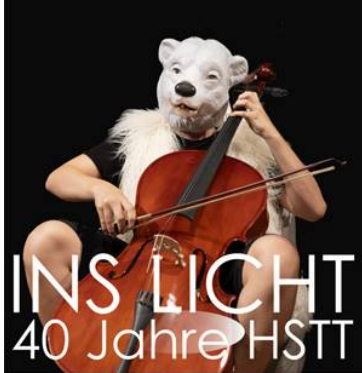
Hessisches Schultheatertreffen 2024 05.-07. Juli 2024 Schloss Hallenburg in Schlitz

Sechs Theatergruppen, sechs Stücke. Dazu Workshops, Nachbesprechungen, Förderpreise und eine Menge theaterbegeisterter Menschen. Das ist das Hessische Schultheatertreffen. Und diesmal feiern wir ein Jubiläum: Seit 40 Jahren setzen wir Schultheaterproduktionen aus Hessen INS LICHT!