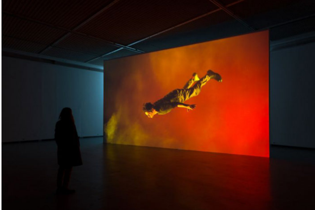
Sebastián Díaz Morales, Suspension, 2013-14. Installationsansicht CAA Vilnius, Litauen