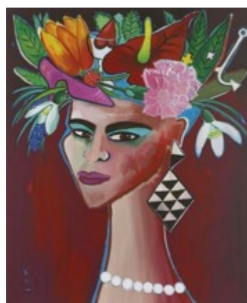
Elvira Bach Meine sieben Sachen, 2014 Acryl auf Leinwand, 230 x 190 cm © VG Bild-Kunst, Bonn 2017

Schulklassen (ab 10 Kinder): 5 € pro Person