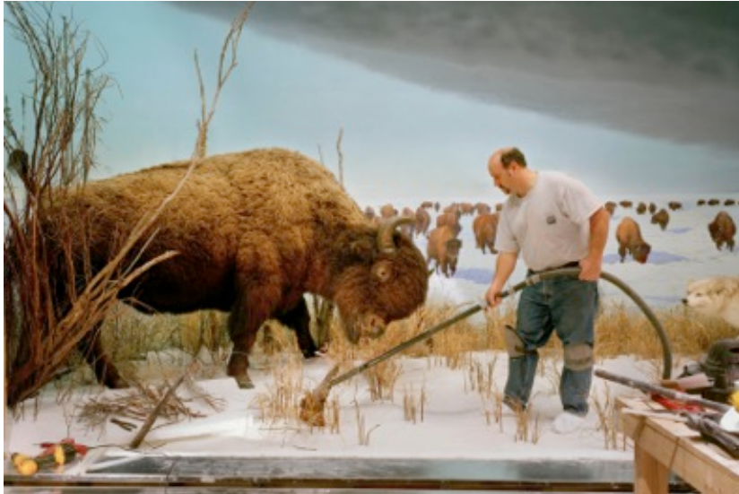
„Man with Buffalo“, Ottawa, 2007,