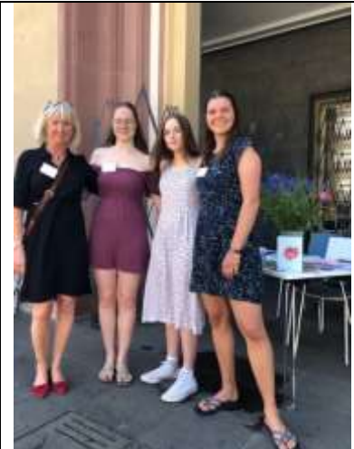
Ein Sonntag für die Literatur