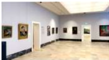
Fotos: Rückseite: Der 20er-Jahre-Raum ist einer der Leseräume.