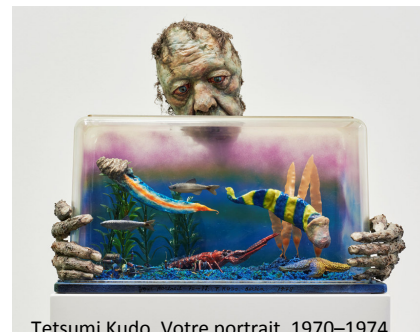
Tetsumi Kudo, Votre portrait, 1970–1974 © The Estate of Tetsumi Kudo / VG Bild-Kunst, Bonn 2016

Pro SchülerIn wird ein Unkostenbeitrag von 2€ erhoben.