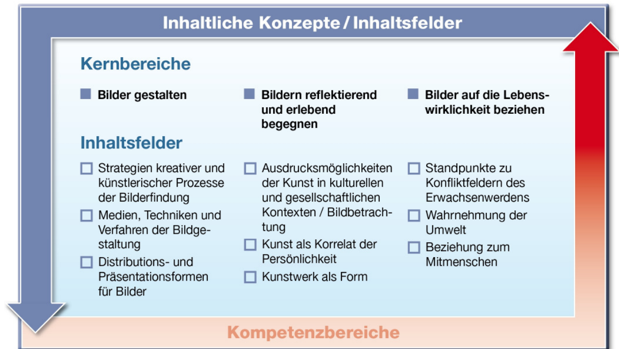
Abb. 2: Kernbereiche und Inhaltsfelder